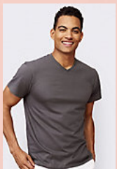
SOL'S VICTORY 11150